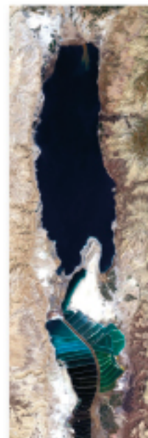
צילום לוויין (אלוס) Satellite image (alos) 2009

בעיקר על עושר הצורות והגוונים שבכל טיסה (ורק בטיסה ניתן לראות זאת), נראים אחרת.