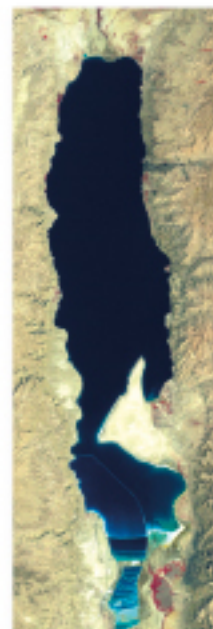
צילום לוויין (לנדסט 1) Satellite image (landsat1) 1972