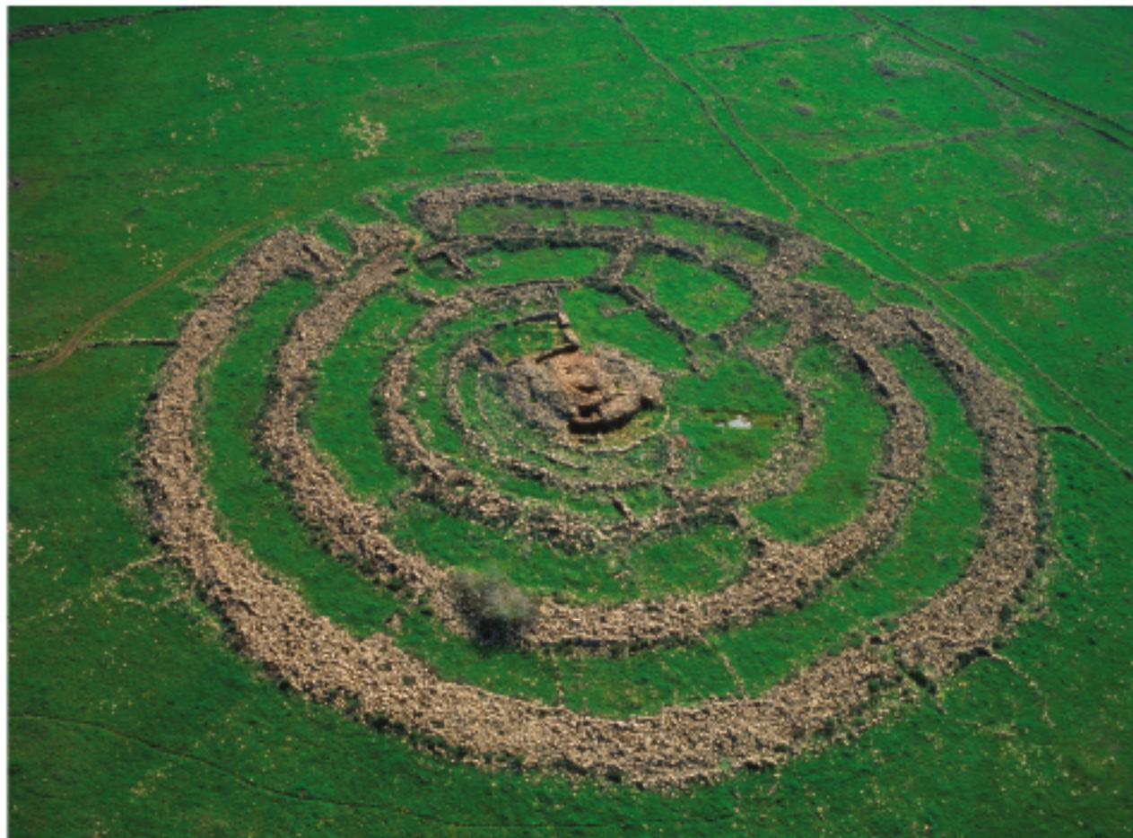
Megalithkomplex Rujm el-Hiri Le complexe mégalithique Rujm el-Hiri