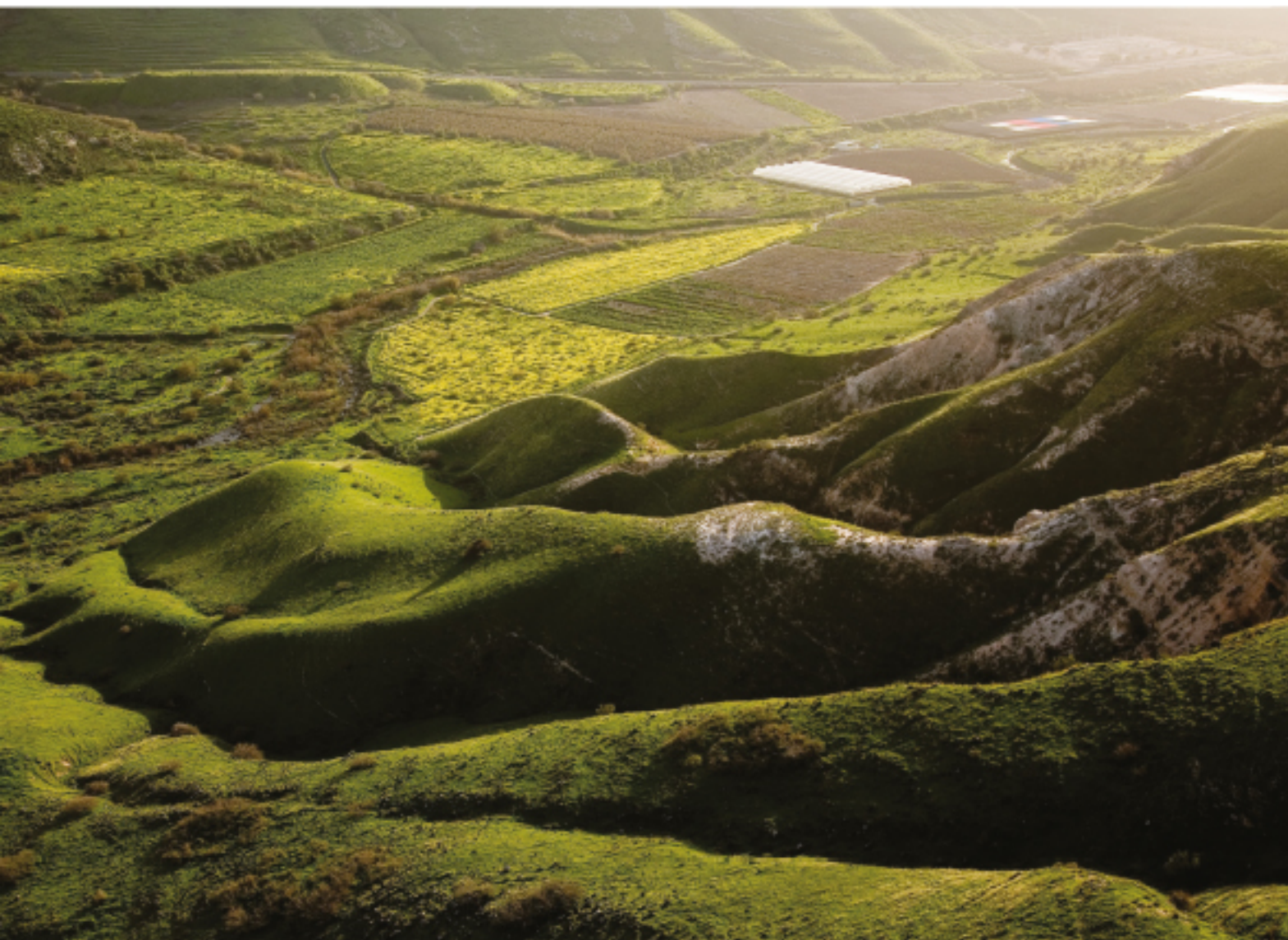
Südliche Golanhöhen Le sud du plateau du Golan