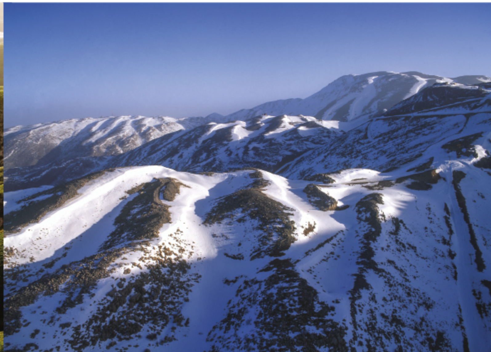
Berg Hermon Le mont Hermon