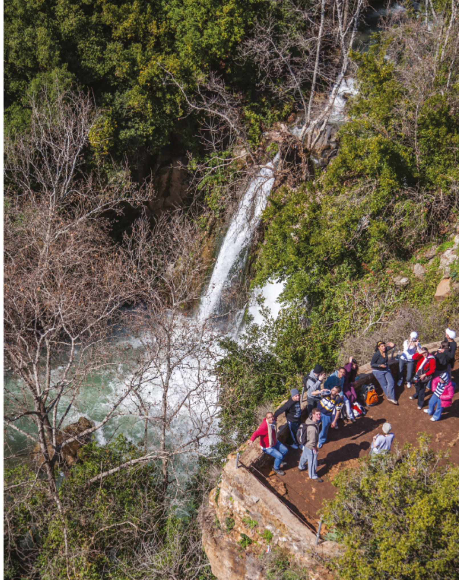
Banias Wasserfall La cascade de Banias